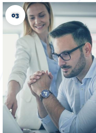
Directorio de Empresas TIC de CLM.