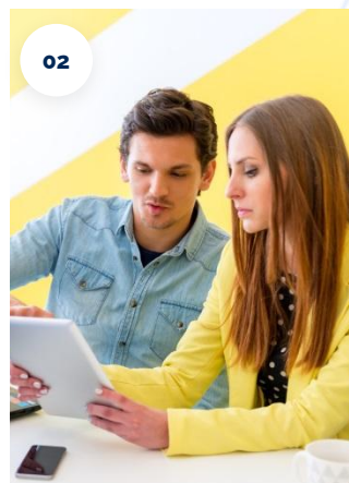
Red de Asesores Tecnológicos de CLM.