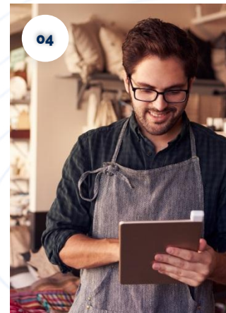
Espacio de Recursos Online para el Desarrollo de Negocios y Emprendimiento.