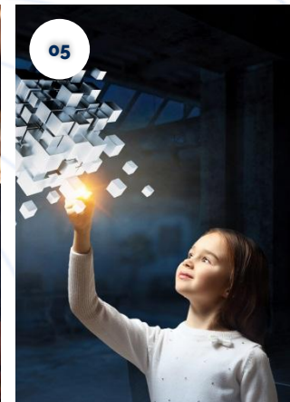
Agenda de Eventos TIC.